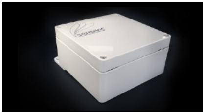
LASCO Outdoor- réf. 1L22003 Détecteur outdoor (IP65)